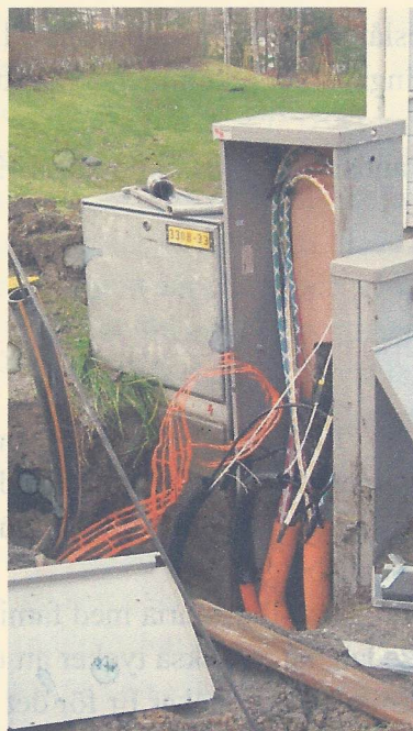
Vilken röra, hoppas dom kopplar rätt!

Energideklarationen är nu slutförd och ett certifikat som utfärdas av Boverket, kommer att utdelas i samband med vattenavläsningen. Certifikatet visar husets energianvändning och kommer att sättas upp i tvättstugan på varmvatten-behållaren i varje hus. Resultatet av undersökningen visar att våra hus ligger inom energiförbrukningsramen som Boverket har fastställt.